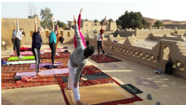
Séance de Yoga en extérieur